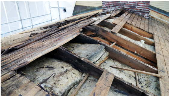
↑ Kunnostettu vesikatto. amoy 2016 ← Kunnostustyöt käynnissä. amoy 2015